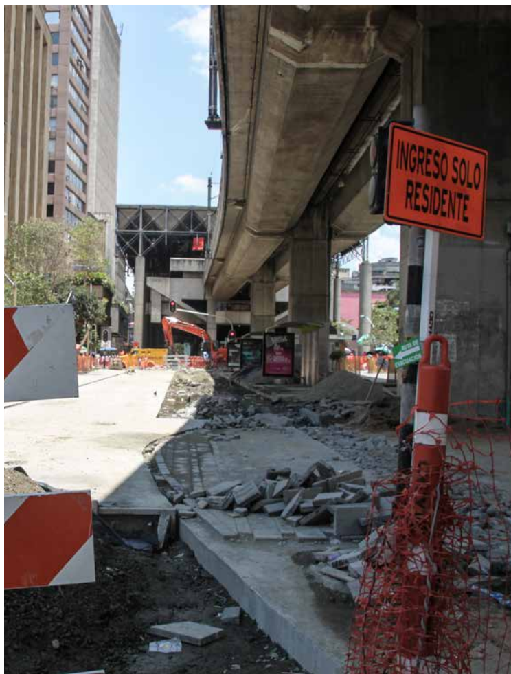
La comunidad convocante celebra las obras y no se opone al progreso, pero sí cree que pueden hacerse sin tantos perjuicios que amenazan comercios y empleos.