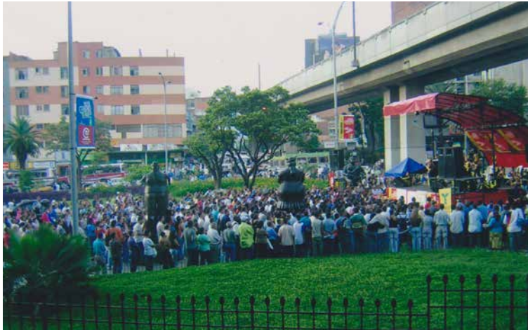
Celebración del día del centro. Corpocentro ha celebrado 11 versiones.

Comprometida con su filosofía fundacional y con un amor profundo por el corazón de la ciudad, la Corporación Cívica Centro de Medellín - CORPOCENTRO - celebra este mes su aniversario 25.