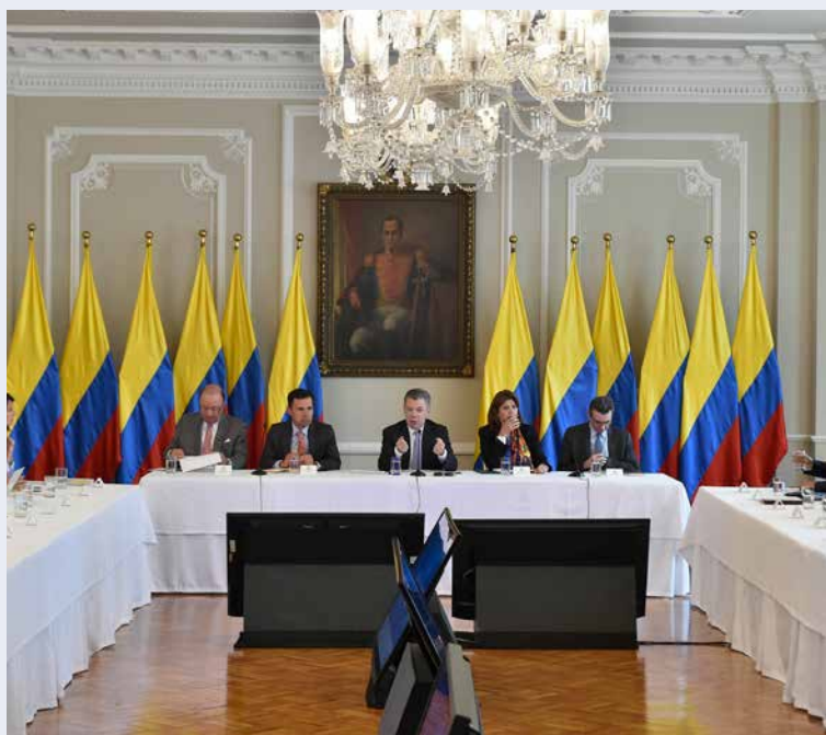
En el año 2015 el Congreso de la República eliminó la reelección presidencial que se había aprobado en 2005.

En nuestro país el presidente es la máxima autoridad administrativa. Conozca de qué se encarga y vote siendo consciente de la importancia de este.