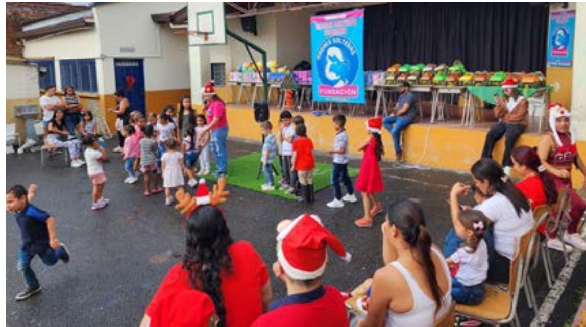
La Fundación realiza actividades lúdicas y recreativas tanto con las madres como con sus hijos.