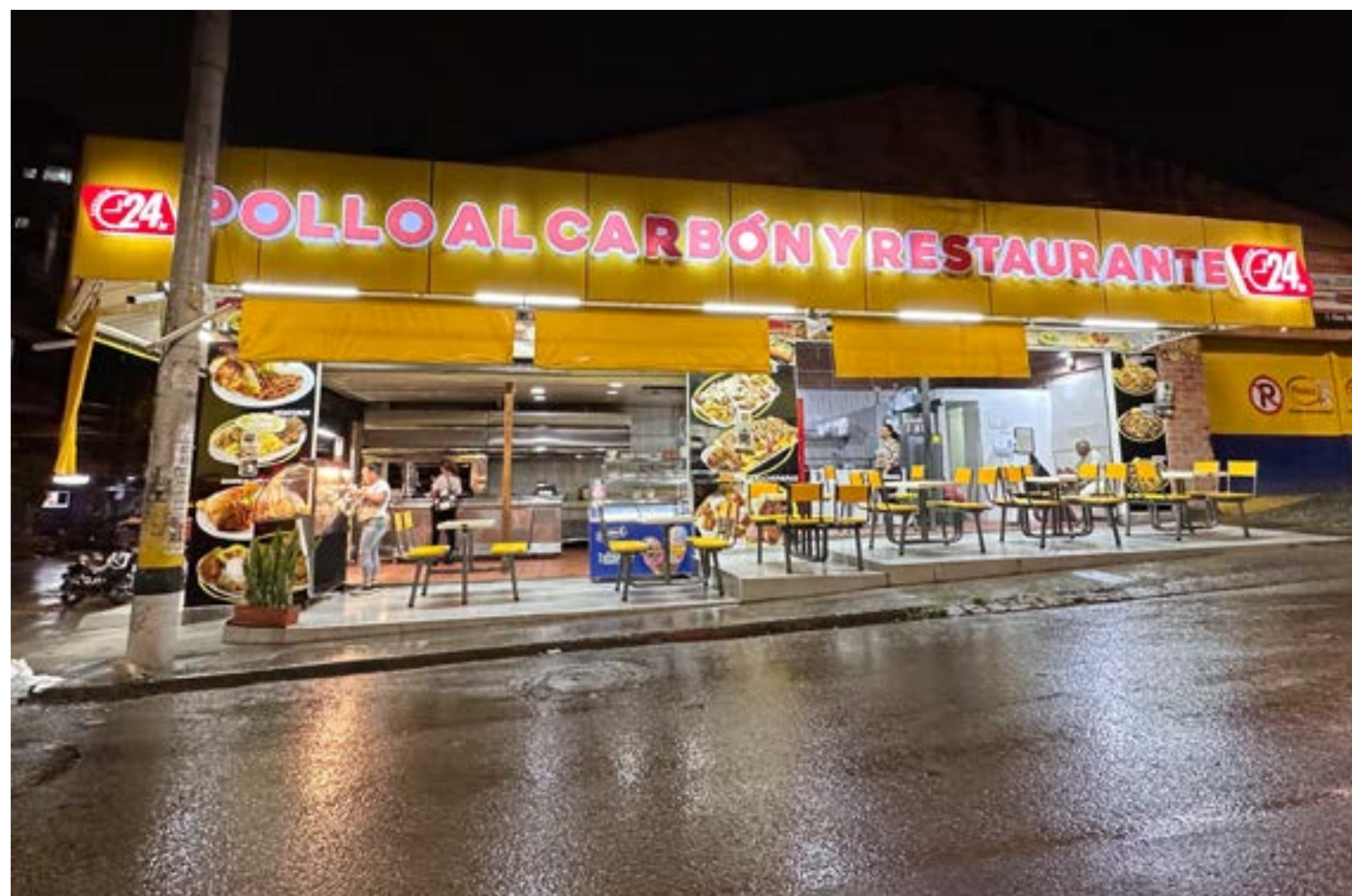
Por: Redacción Centrópolis

Las dos de la mañana, la calle Juan del Corral, esa que también es conocida como la calle de los muertos debido a las múltiples funerarias que tienen su sede allí, hace honor a su apodo, pues parece un verdadero cementerio.