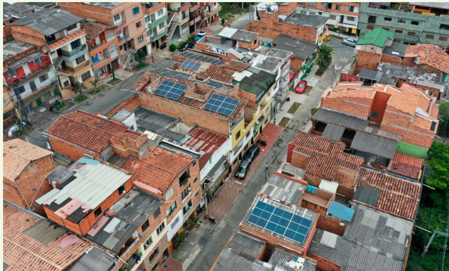
Un sistema con 43 paneles fue instalado en tres viviendas para este proyecto de comunidad solar.

Historia de cómo la capacidad de concertar de una comunidad del barrio El Salvador, de la comuna 9 de Medellín, se convirtió en un proyecto piloto de energía solar que es pionero en América Latina.