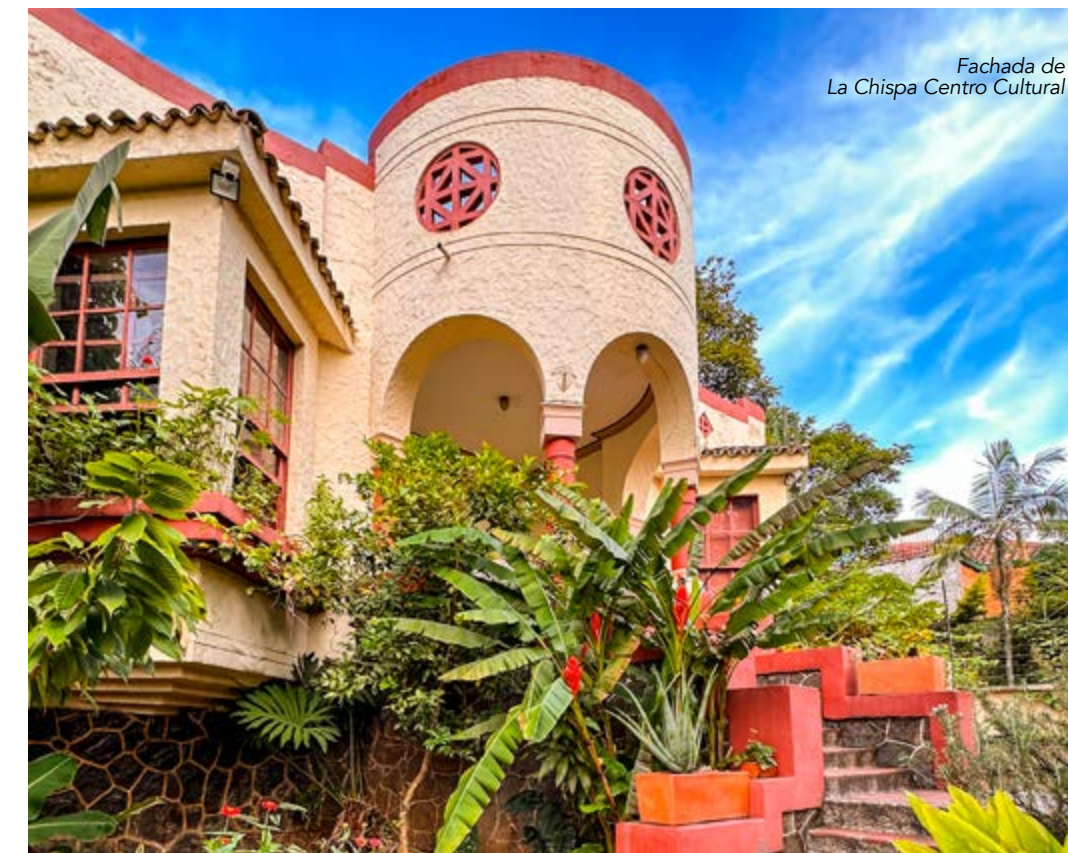
Fachada de La Chispa Centro Cultural

Su lema “Una locación para el arte” es perfecto para describir esta galería ubicada en Palacé con Moore, exactamente en la carrera 50 #61-6. La que antiguamente fue una vivienda familiar de dos plantas, desde hace un año es una locación