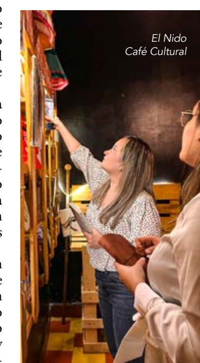
El Nido Café Cultural

Desde su inauguración en el 2000, el Teatro Prado ofrece a los visitantes programación permanente, con un promedio de 200 funciones al año a cargo del grupo El Águila Descalza y otros reconocidos artistas invi-