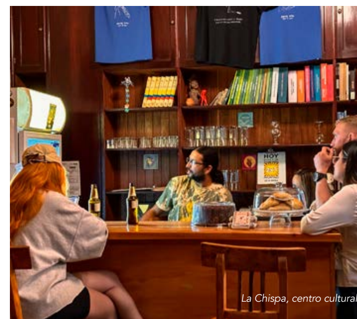
La Chispa, centro cultural

La agenda de eventos de este espacio puede ser consul-