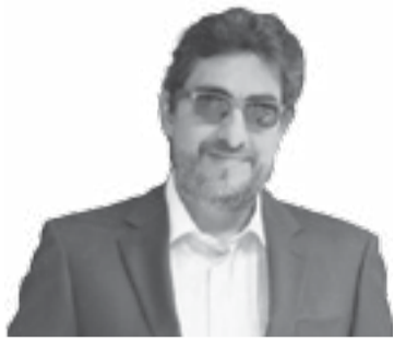
Por: Juan Moreno

“Hago entre 17 y 20 al día, son como unas 6.000 al año”, me cuenta el urólogo que me va a realizar la vasectomía en instantes. Para mí es la primera del día, del año, de la vida, y por eso nuestros estados de ánimo son diferentes. Yo estoy expectante por el dolor que pueda sentir y la situación de indefensión por causa de una bata elaborada en una tela que más parece papel. Él, está cumpliendo una rutina matizada por chistes internos con la enfermera y la instrumentadora que nos acompañan en uno de los quirófanos de Profamilia, una entidad sin ánimo de lucro que, literalmente, opera en una casona antigua de media cuadra de frente, ahí en la calle Caracas, entre Girardot y, alegóricamente, El Palo.