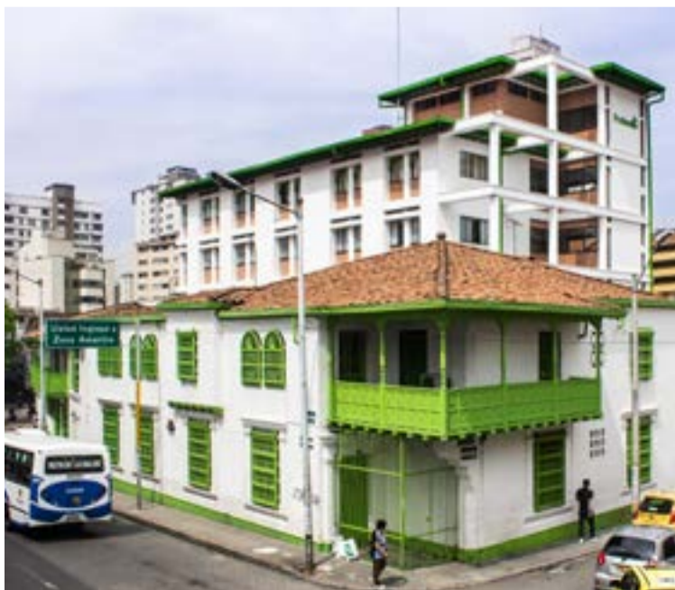
Profamilia, entidad sin ánimo de lucro que opera en la calle Caracas, entre Girardot y El Palo.

El procedimiento termina entre risas y camaradería. Aunque soy un número más. Los facultativos son cálidos, profesionales, eficientes. La recuperación no tarda nada. Estoy listo para volver al mundo. Salgo a la calle Caracas a organizar mis ideas, pensando en que ya lo único que quiero tener fértil es la imaginación... Y el bolsillo. Aunque para esto último, no hay cirugía que valga.