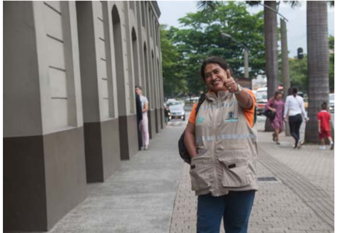
Semillas que Crecen, Fundación Visibles, Ave Fénix, Nave de los Sueños, Aguapaneleros, Aguapanelazo y voluntariados cristianos complementan el trabajo oficial.

En la calle encontraba el dinero para seguir drogándose, ya fuera robando o mendigando, no impor-