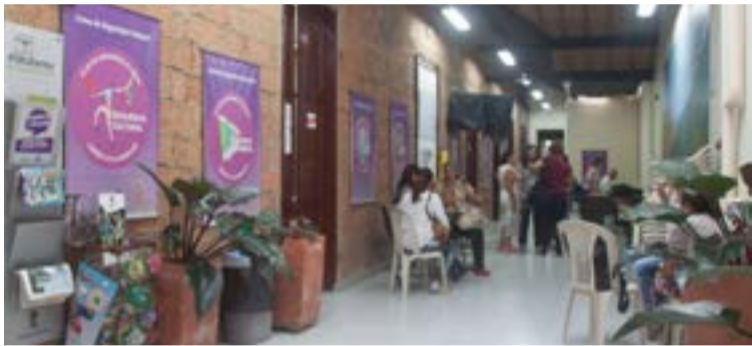
De las 13 JAC de Comuna 10, cinco tienen sede: Prado, Boston, Las Palmas, Colón y El Chagualo. Las que carecen de sede propia suelen reunirse aquí, en el Centro de Desarrollo Social de la Comuna 10.

Una nueva Junta de Acción Comunal (JAC), la número 13 de la Comuna 10, estaría entrando en funcionamiento para el bienestar de su zona. Poco se sabe de esta. Se espera mayor información.