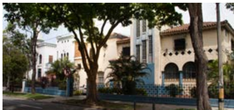
Barrio Prado, zona reconocida por su gran valor patrimonial.

No se trata entonces de anhelar, de vivir con nostalgia, sino de actuar inmediatamente.