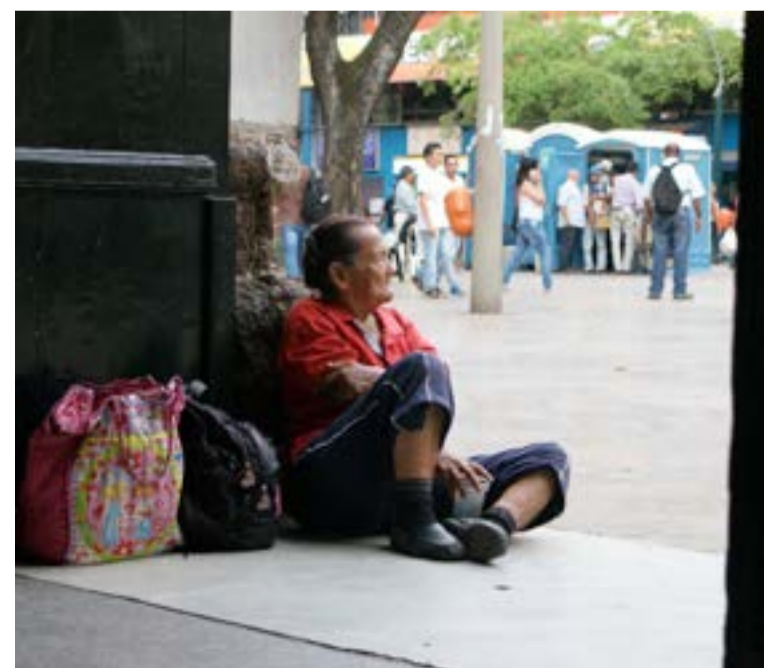
El censo de habitantes de y en calle data de 2008. De los primeros habría 3,250 y de los segundos 25,000 en Medellín.

En La Candelaria, aparte de los dos Centro Día que reciben 1.500 personas por jornada, funcionan dos dormitorios para 360 abuelos de calle, convenios con cuatro hoteles en Guayaquil para quienes aceptan empezar su recuperación en las dos granjas destinadas para ello en San Cristóbal, un centro de formación en el barrio Prado, un albergue en Juanambú para enfermos de tuberculosis y otro en Corazón de Jesús para personas con discapacidad cognitiva severa.