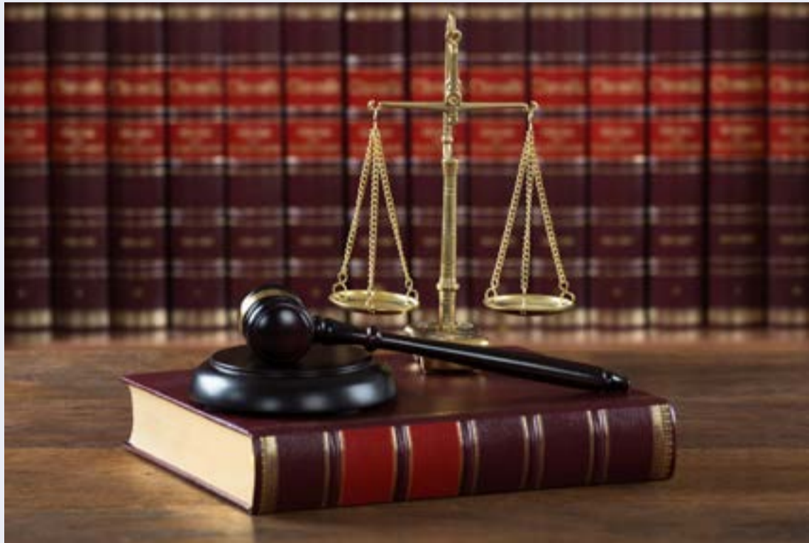
El proceso de una ley está integrado por las fases de iniciativa, debate y sanción.

Las leyes, decretos, ordenanzas, acuerdos y resoluciones, ayudan a regular la convivencia entre los ciudadanos y sus intereses particulares. ¿Cuál es la diferencia entre estos? Le explicamos.