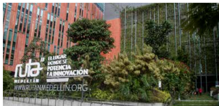
La sede de Ruta N se quedó pequeña y no se descarta un futuro "Ruta N2" al frente del primero, pasando Barranquilla, proyecto del que todavía no hay nada definido.

Con la Secretaría de Seguridad queríamos saber cómo llegar a los niños que tienen mayor riesgo de ser reclutados por bandas criminales. Con ese reto pudimos cruzar variables informativas de 16 mil niños sobre deserción escolar, mal desempeño académico, composición familiar, comportamiento de padres, existencia de bandas. Nos arrojó 500 niños en el mayor riesgo y eso permitió focalizar la oferta institucional para evitarlo.