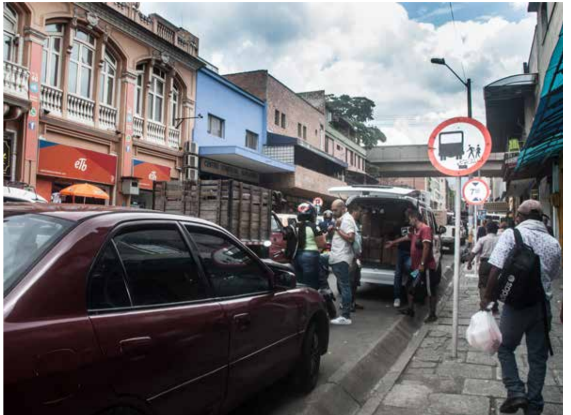
"Es un ratico", "qué pereza guardar el carro por eso", "a esta hora no pasa nada", son algunas de las excusas que usan los conductores para parquearse dónde no deben hacerlo.

Pese a que el mismo funcionario anunció una nueva ZER para este año alrededor del centro comercial Sandiego, y otras dos más adelante