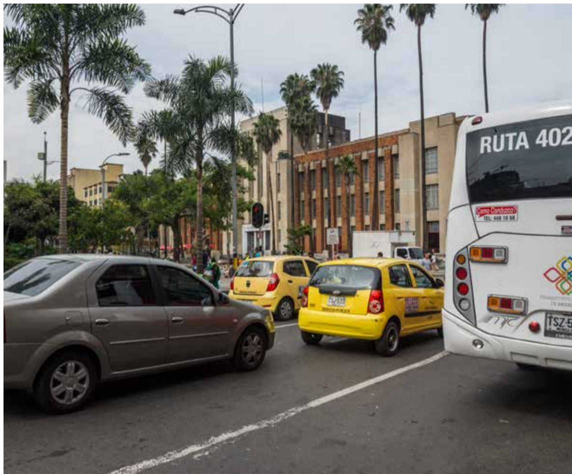
La Estación Centro Tráfico, ubicada en Plaza Botero, es la unidad que a través de los estudios de la calidad del aire en el centro, ha determinado que es un área de alta contaminación vehicular y a partir de allí surge la resolución que establece las ZUAP.

Acciones con la soga al cuello Desde el 2015 en la Estación Centro Tráfico, unidad ubicada en Pla-