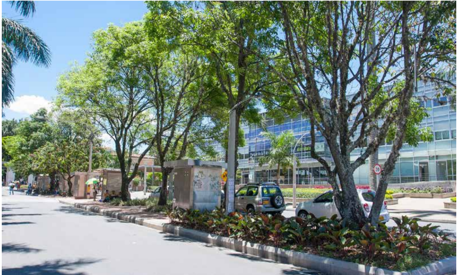
Medellín cuenta con 19 zonas de estacionamiento regulado (ZER), de esas, nueve operan en el centro y se proyectan otras tres en Sandiego, Palacé y Placita de Florez.

A raíz de tales diagnósticos, la administración municipal ideó y ha