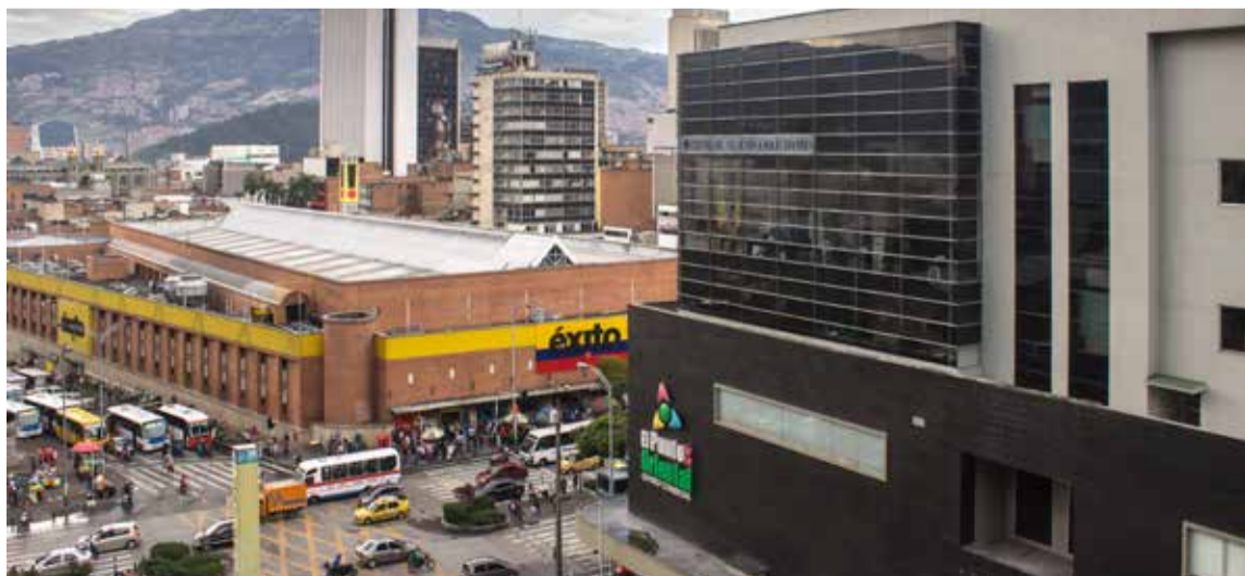
El Centro de Atención al Solicitante está ubicado en el centro comercial El Punto de la Oriental.

Todo se resume en decir la verdad y en nada de nervios. Hay gente a la que no le dan la visa, claro, pero es que no se asesoran, se inventan disparates o muestran demasiado la gana de quedarse lavando baños o cuidando niños, para después llorar cuando escuchan el himno y añorar la pobreza de aquí, que al fin y al cabo es nuestra y como esa, ninguna.