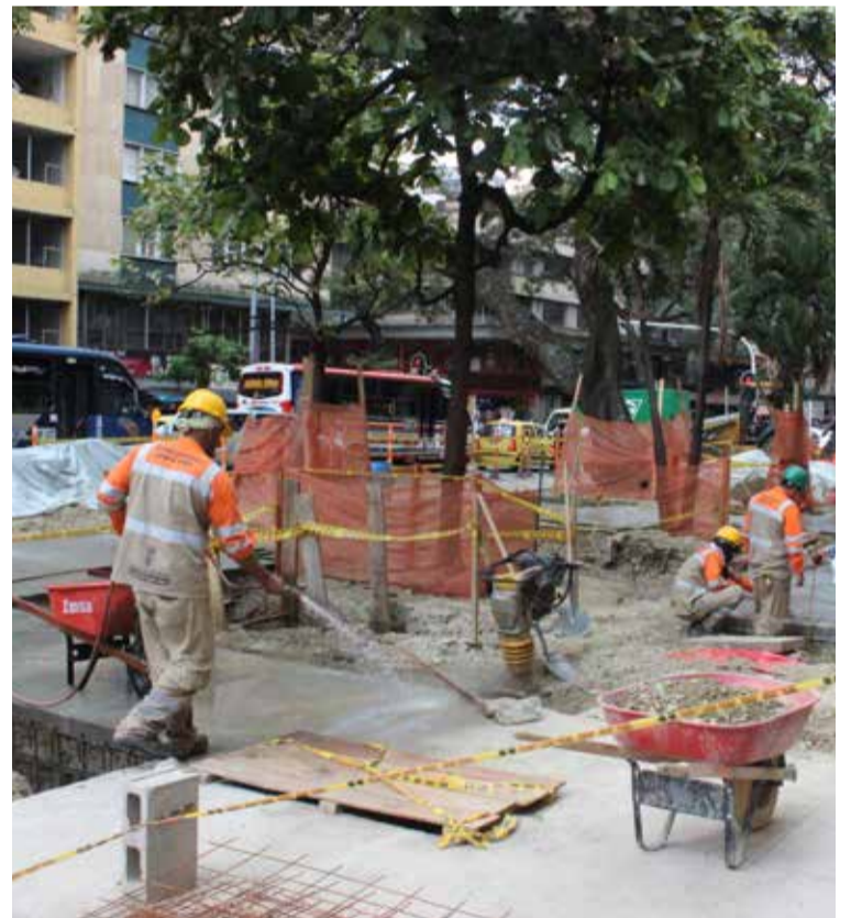
Habrán mejoras en las calzadas de Carabobo sur, Palacé, Oriental y Colombia. Sobre esta última, se estudia la posibilidad de construir una ciclorruta que conectaría Bolívar con el Estadio.