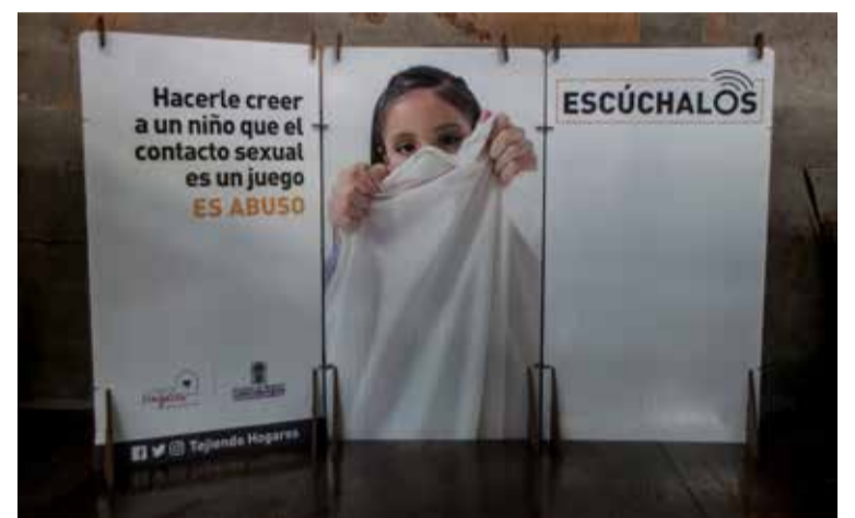
La sensibilización también impacta en las capturas de abusadores. En 2017 se detuvieron a 112 y hasta agosto de este año la cifra iba en 132.

De igual manera se quiere fortalecer la atención a las víctimas, en articulación con Comisarías de Familia, Fiscalía, representantes de EPS, clínicas e IPS y profesionales de instituciones educativas. Se ofrece atención psico-terapéutica para los niños y sus familias, y se están mejorando 11 lugares en los cuales se les atiende.