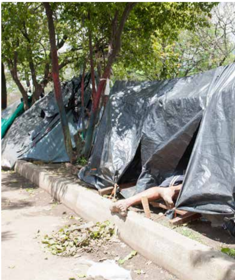
La población habitante de calle es la que tiene mayor riesgo de contraer enfermedades infecciosas porque viven a la intemperie.

Por su inestabilidad social y económica y sus condiciones de vida a la intemperie, los habitantes de calle tienen mayor riesgo de contraer enfermedades infectocontagiosas. Aquí el panorama.