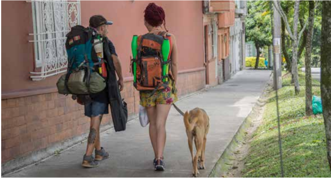
Hasta mascotas llevan consigo algunos mochileros. Estas también son bien recibidas en los hostales.

Cada vez son más los turistas que llegan a Medellín con necesidad de hospedaje barato. Esta situación ha sido aprovechada por algunas personas para poner a funcionar hostales sin registro. ¿Qué hay detrás de esta forma de alojamiento?