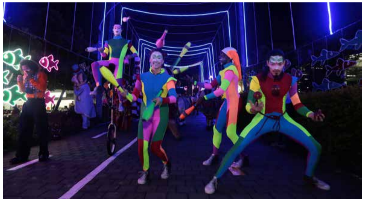
La época navideña es propicia para disfrutar en familia de la oferta cultural que tiene Medellín.

De acuerdo con la Secretaría de Cultura Ciudadana, en Navidad también tendrá lugar el habitual mercado artesanal de San Alejo, en el Parque Bolívar, el sábado 15 de diciembre entre las 8 a. m. y las 6 p. m.