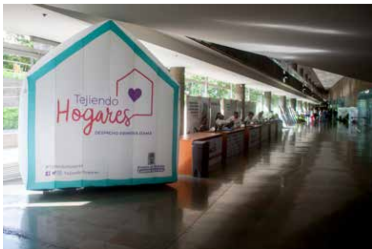
El abuso sexual infantil es un drama silencioso que está devorando la sonrisa de muchos de nuestros niños, niñas y adolescentes. Denuncie.