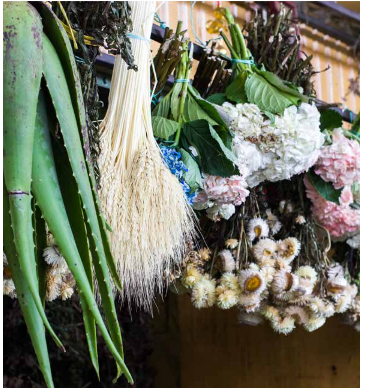
En la Placita de Flórez pueden encontrarse todo tipo de baños, riegos y plantas aromáticas para terminar y empezar bien el año.

“El riego con rompe saragüey, vencedora, cicuta, salvia, altamisa, verbena y tunda para limpiar el aura y un despojo amargo para sacar toda la mala energía. Se baña con eso tres días para atraer el amor y el dinero”. Ella me nota la cara de escepticismo y contraataca: “es un baño sagrado, no es brujería”.