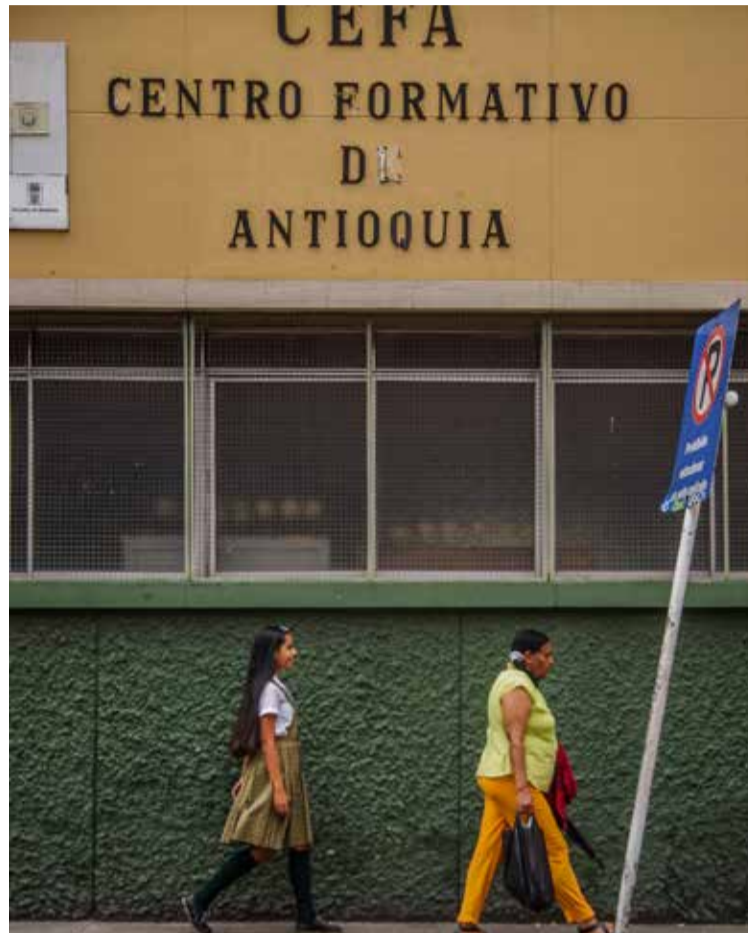
En Medellín hay, en total, 631 colegios, 57 de ellos están en el centro.

Por la cantidad de estudiantes, el tema de la calidad es especialmente sensible en el centro de Medellín. Allí tienen sede una gran cantidad de colegios, muchos de ellos ofrecen validación y jornadas nocturnas donde los resultados no han sido los mejores. El informe mencionado tiene cifras que son aún preocupantes, por ejemplo, la tasa de deserción en educación media es del 2.2%, para secundaria es del