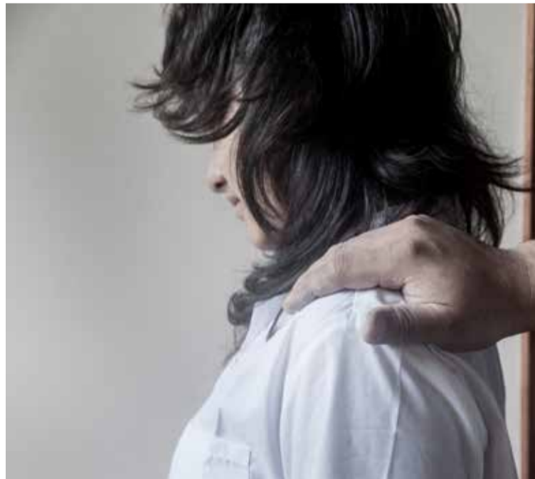
Para el ICBF son cerca de 37 los episodios de abuso sexual infantil denunciados cada día en Colombia.

Castro resalta en consecuencia la importancia de prevenir al máximo y por eso su apoyo a las actividades formativas. En el marco de este esfuerzo municipal, cerca de 43 mil personas entre niños y adultos, han participado en algún tipo de taller sobre herramientas específicas de prevención del abuso sexual infantil y mejoramiento de las relaciones interpersonales.