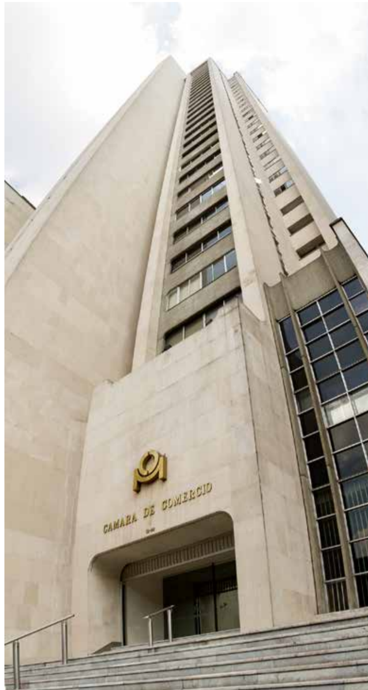
La sede centro de la Cámara de Comercio de Medellín para Antioquia continúa siendo la casa principal de la organización.

Nunca se ha considerado. Esta organización tiene la vocación de descentralizar algunos servicios y acercarle oportunidades a empresarios no solo de Medellín, sino de los otros 68 municipios que componen su jurisdicción. Esta inciativa la hacemos con una oferta presencial y una plataforma virtual que les per-