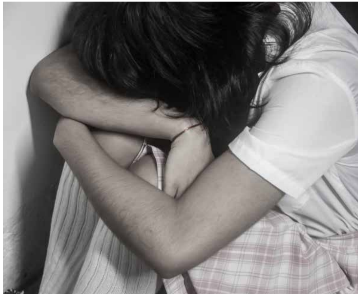
Si un niño le habla de abuso: créale. Tome medidas inmediatas para evitarle más riesgos. Denuncie y busque ayuda. Todos los adultos somos responsables del cuidado de los niños.

Con el acompañamiento de expertos y reconocidas entidades que trabajan con familias e infantes, el programa Tejiendo Hogares ha logrado consolidar unas herramientas de crianza que incluyen observación constante por parte de los adultos cuidadores (padres, tíos, abuelos, maestros, aunque a la larga debemos ser todos) para