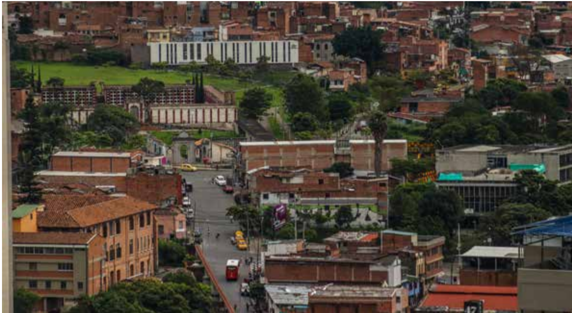
El sector de Niquitao concentra, sobre una tercera parte de su territorio, una población marginal que vive de las actividades del sector informal.

Históricamente Niquitao ha sido albergue para las comunidades que llegan a Medellín tras perder la seguridad que tenían en sus tierras. Campesinos, ecuatorianos, indígenas Embera y, más recientemente, venezolanos, son algunos de los habitantes del sector.